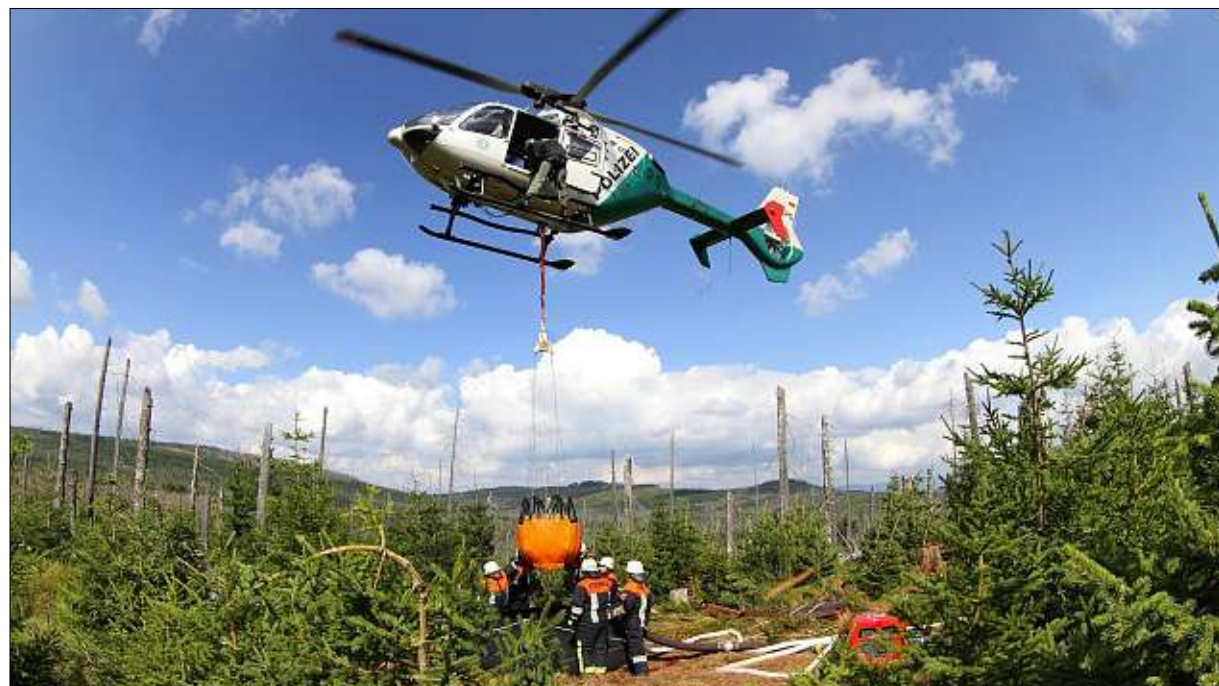
Der Hubschrauber bringt das Wasser , die Feuerwehr löscht am Boden. Am Samstag herrschte am Farrenberg Hochbetrieb. Die letzten Glutnester wurden beseitigt.

Farrenberg: Großeinsatz am Boden und der Luft