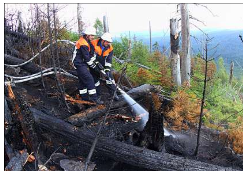
Nur vom Boden aus konnten die Glutnester punktuell genau bekämpft werden.

Fast den ganzen Tag über war am Samstag die Luft über dem kleinen Bayerwaldort Finsterau von Motordröhnen erfüllt. Pausenlos waren zwei Hubschrauber zu sehen, die die örtlichen Feuerwehrkräfte im Kampf gegen die hartnäckigen Glutnester am Farrenberg unterstützen. Der größere von beiden, ein Transporthubschrauber des Bundesgrenzschutzes, diente mit seinem Behälter, der rund 1500 Liter fassen konnte, als Wassertransporter, die nahe gelegene Reschbachklause diente ihm sozusagen als großer Wassereimer. Der kleinere Polizeihubschrauber brachte