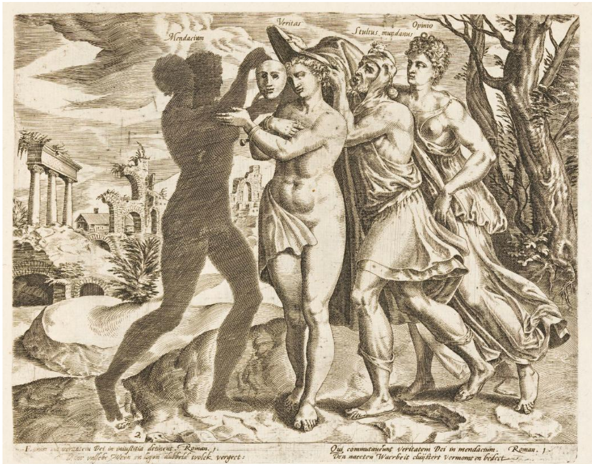
H. Goltzius, D. Volckertz. Coornhert, False Opinion ruins the World (engraving, Rijksmuseum, Amsterdam)